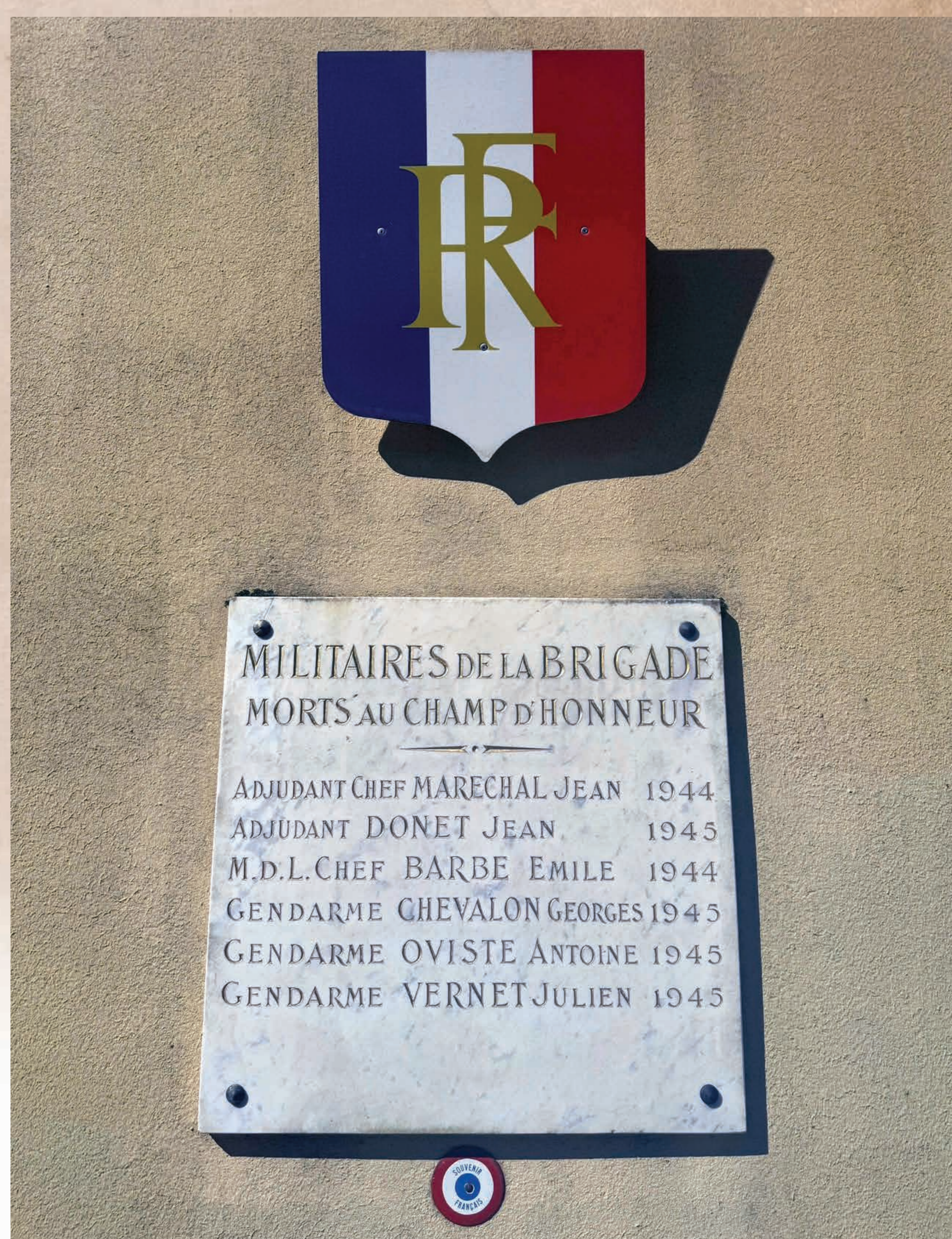
Plaque des militaires de la brigade de Nantua morts au Champ d'honneur

Le 12 février 1944, ils sont embarqués par voie ferrée en direction de Bellegarde pour être déportés. Ils échouent le 25 mars 1944 au camp de Mauthausen. Aucun n'est revenu.